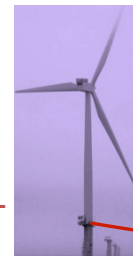
Vindmølle i sjø - leieavtale