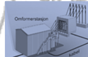
Omformerstasjon på land